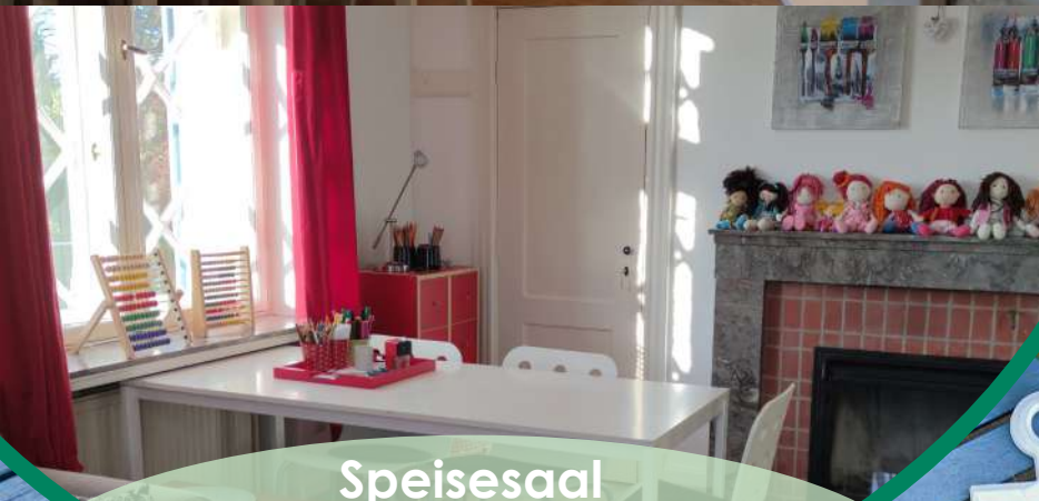
Speisesaal & Spielzimmer